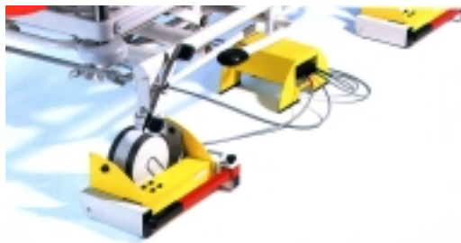
Način postavljanja noge kreveta