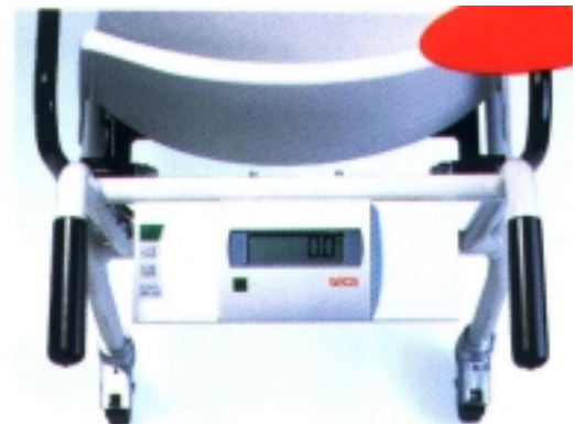
SECA (958 i 959)