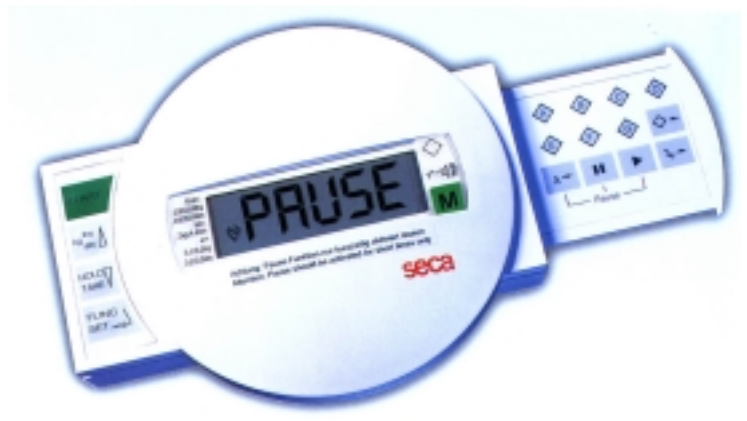
EPU SECA 435